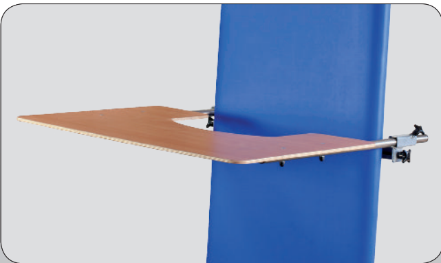
Therapietisch Holz Art.-Nr. 20.025.00.000