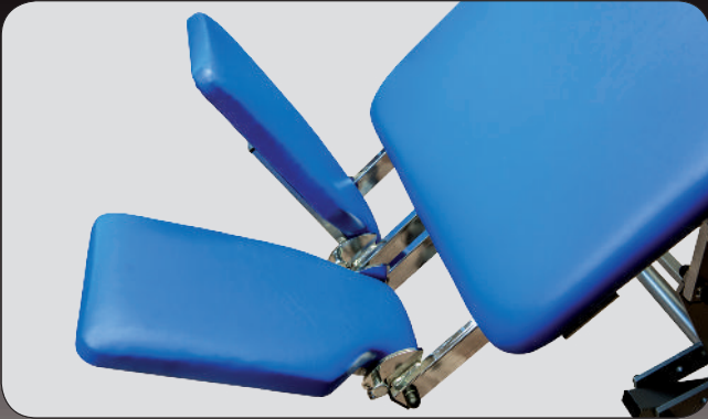
winkel- und längenverstellbare Fußplatten Art.-Nr. 20.021.00.000