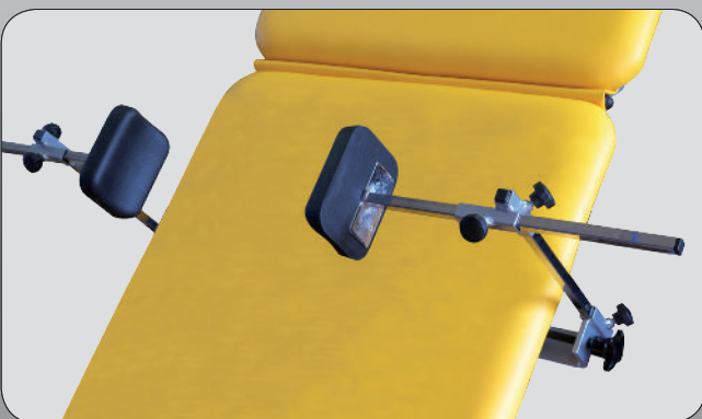
3-fach verstellbare Hüft- und Oberkörperpelotten Art.-Nr. 20.033.00.000