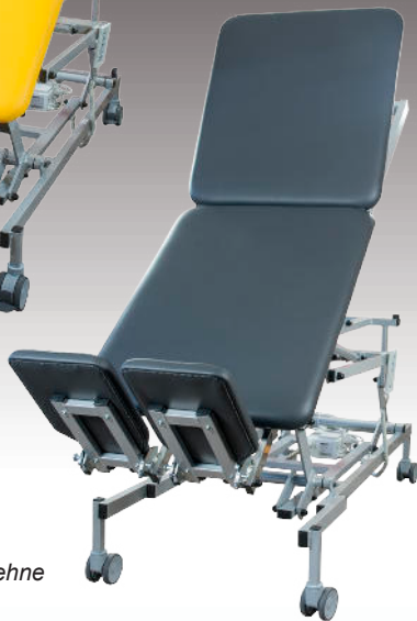
Ausführung mit verstellbarer Rückenlehne

Das Stehbrett gewinnt im ergo- und physiotherapeutischen Bereich auf Grund seiner Vielfältigkeit immer mehr an Bedeutung. Selbstverständlich kann es ebenso als Behandlungsliege genutzt werden.