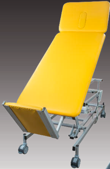
Ausführung mit positiv und negativ verstellbarem Kopfteil

Das Stehbrett ermöglicht neben den bekannten Behandlungsliegenfunktionen ein stufenloses Aufrichten des Patienten aus der liegenden Position bis maximal 85°. Der Patient wird durch drei Haltegurte im Knie-, Becken- und Brustbereich fixiert. Das Gerät erfüllt durch seine hochwertigen Komponenten höchste Qualitätsstandards und zeichnet sich durch sehr gute Standfestigkeit und lange Lebensdauer aus.